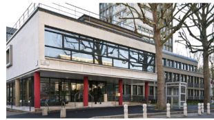
MDPH - MAISON DÉPARTEMENTALE DES PERSONNES