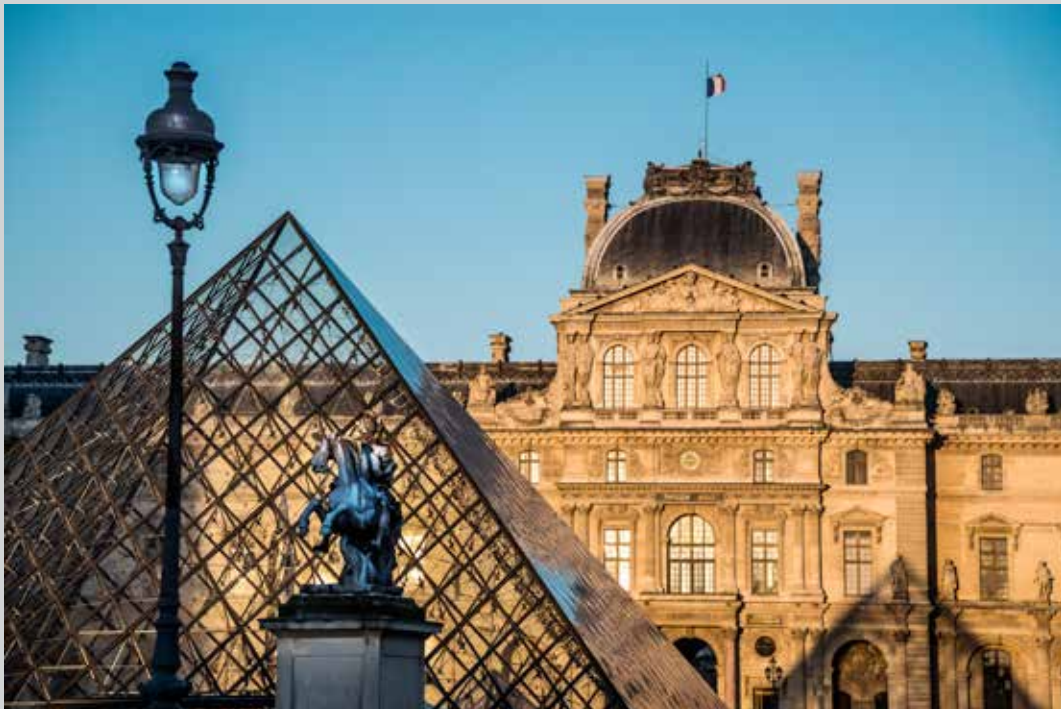
Cour Napoléon

Environ 2100 agents travaillent au Louvre, 65 conservateurs, 8 directeurs de grands départements patrimoniaux, 166 personnels de conservation, 1200 agents de surveillance, et une brigade de 48 sapeurs-pompiers de Paris 24 heures sur 24. Auxquels s'ajoutent des intervenants extérieurs de toutes natures (maintenance technique, surveillance externe, laboratoires, restaurateurs, intervenants culturels...).