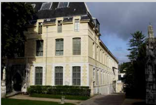
Musée départemental des Antiquités

Ainsi le public découvre des statuettes, des bijoux, des objets, des pièces de mobilier qui composent un patrimoine de qualité appartenant à l'histoire de l'humanité.