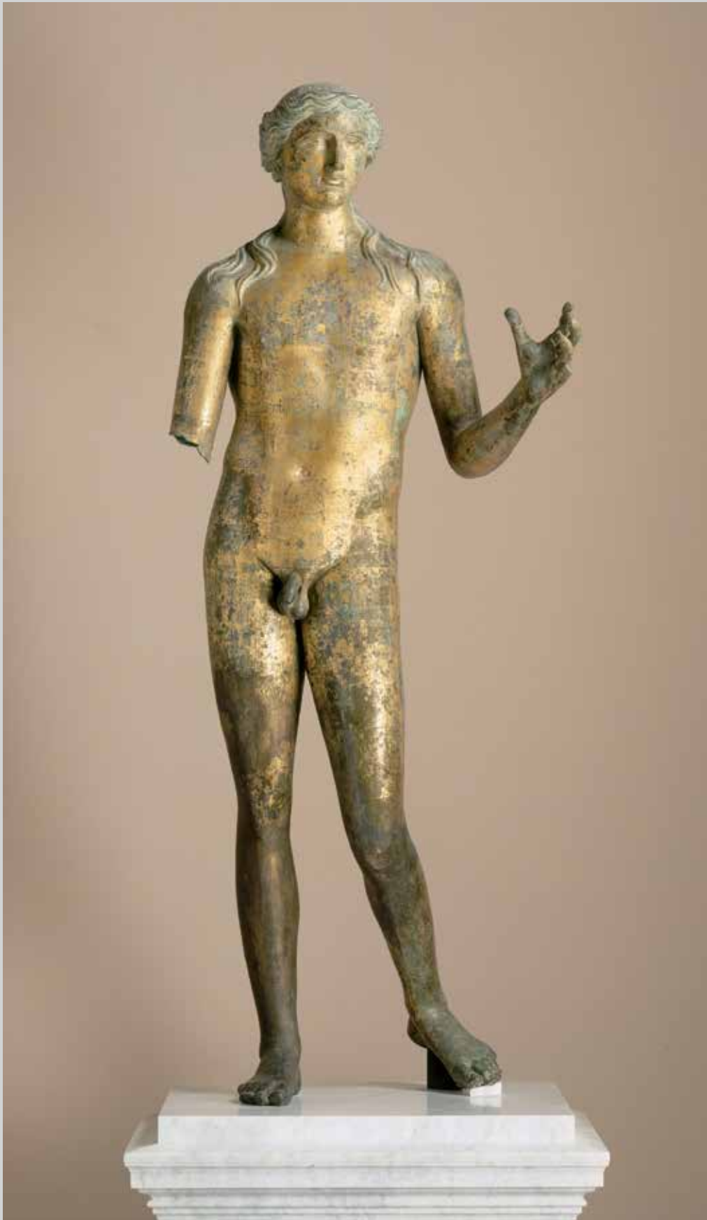
Apollon de Lillebonne (Br.37)