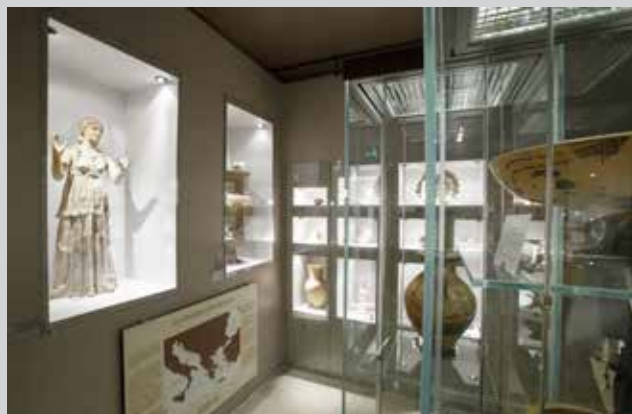
Salle grecque