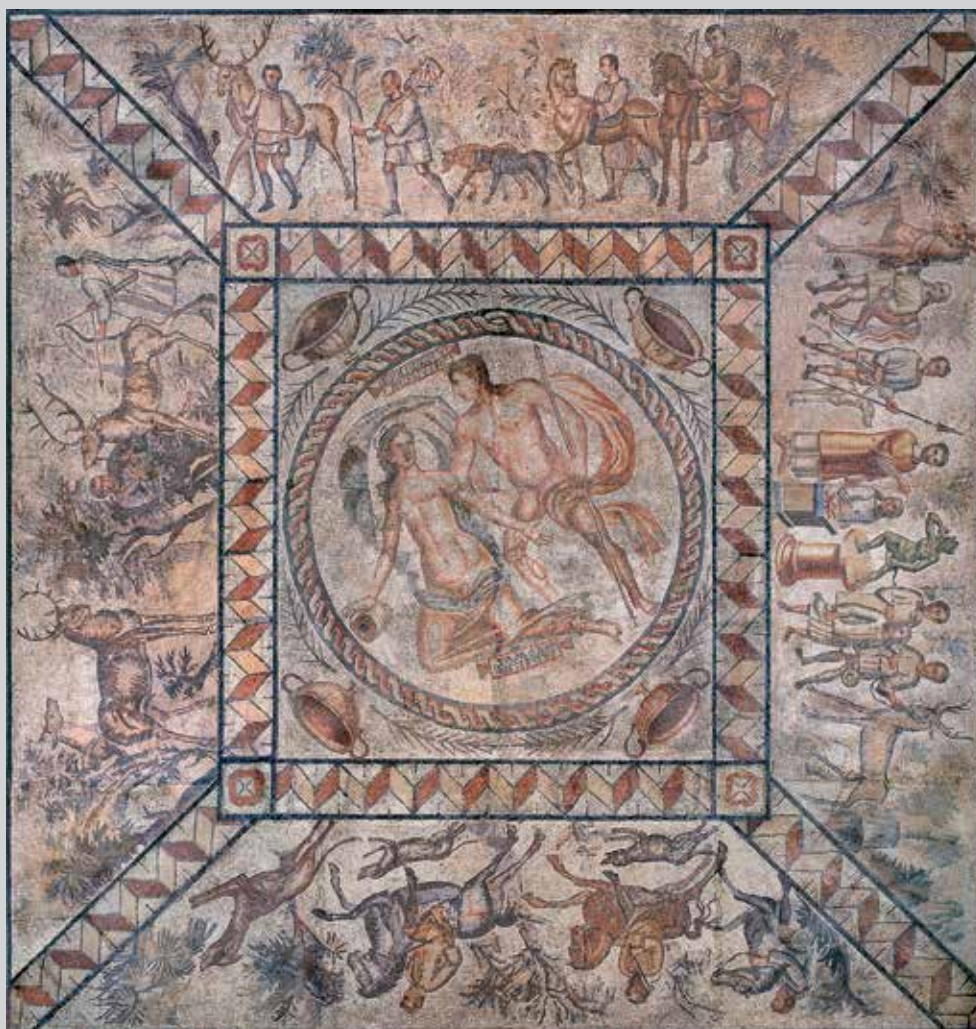
Mosaïque : «Chasse à l'appelant» © Yohann Deslandes - Département de Seine-Maritime

Construction en groupes de 16 élèves maximum d'une maquette de ferme gauloise et d'une maquette de villa gallo-romaine, pour comprendre les différences d'organisation, de matériaux utilisés, de techniques de construction.