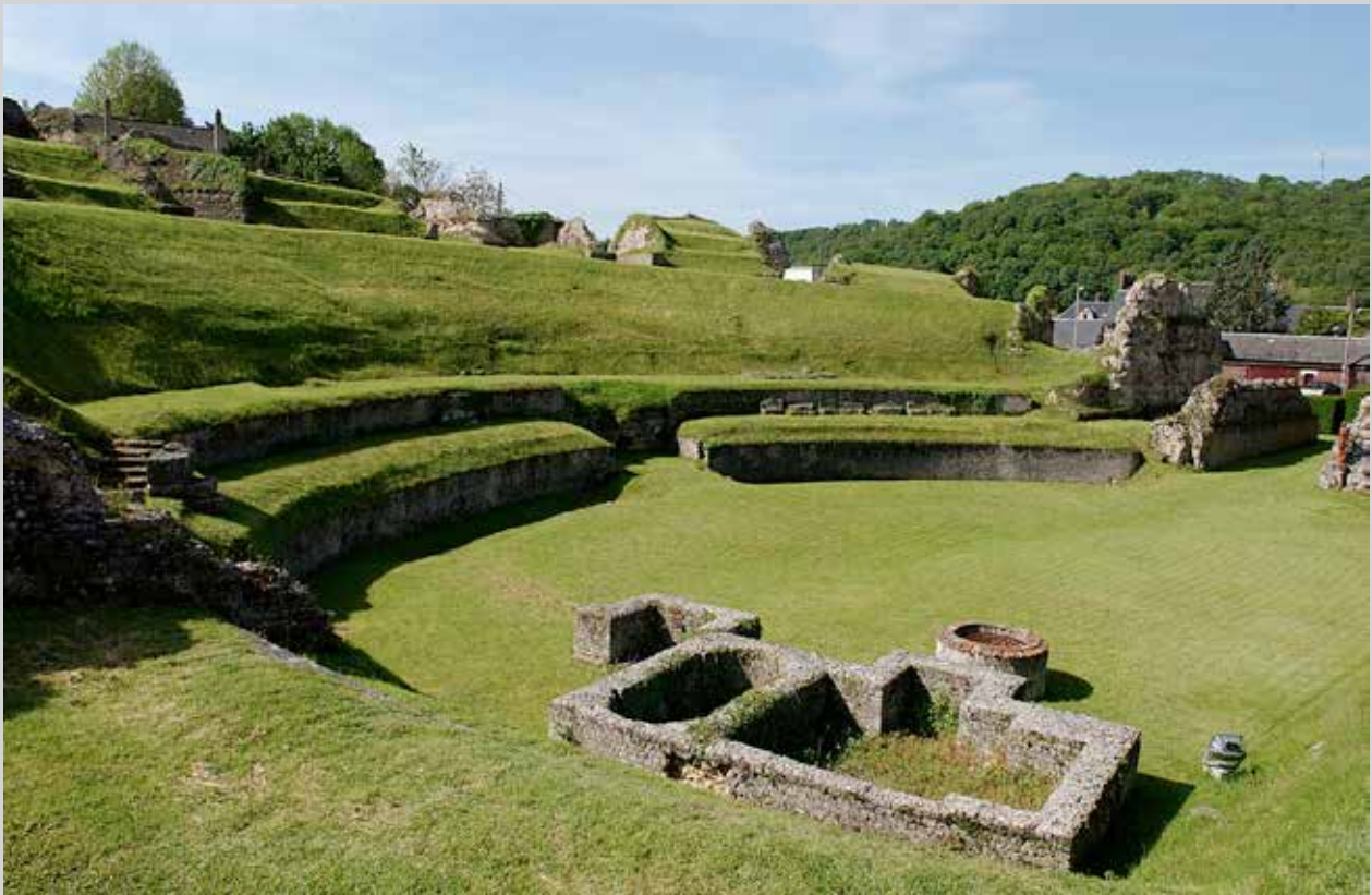
Théâtre gallo-romain de Lillebonne

À la période gallo-romaine, la ville de Lillebonne connut une période de grande prospérité liée à la présence d'un port sur la Seine. Au III ème siècle, Lillebonne est mentionnée dans La Géographie de Ptolémée sous le nom de Juliobona. Le nom gallo-romain de Juliobona est composé de deux éléments : Julio, forme déclinée de l'anthroponyme Julius, donné en l'honneur du général Jules César, conquérant de la Gaule, et bona, terme gaulois désignant soit une « fondation urbaine » ou peut-être une « source ». Juliobona est donc « la ville fondée sous Jules César » ou plutôt, « la ville fondée en l'honneur de Jules César ». L'enceinte délimitait alors une aire urbaine d'environ 50 hectares. Elle possédait un théâtre-amphithéâtre, un lieu de mithraeum (pour le culte du dieu Mithra) et des thermes romains et était environnée de riches villas et de domus (habitations urbaines). Des fouilles effectuées tout au long du XIX ème siècle permirent de remettre au jour de nombreux vestiges. Depuis 2007, de nouvelles fouilles sont en cours afin de mieux connaître l'attribution du théâtre.