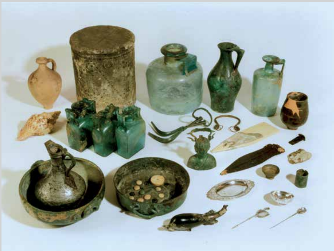
Mobilier de la «Tombe de Marcus»