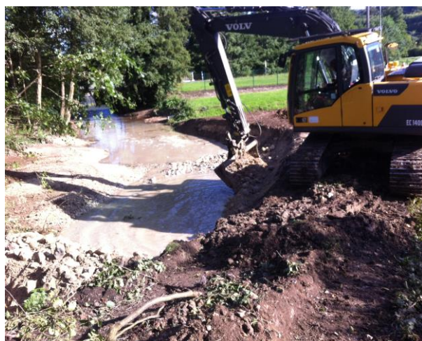
Terrassement du nouveau lit