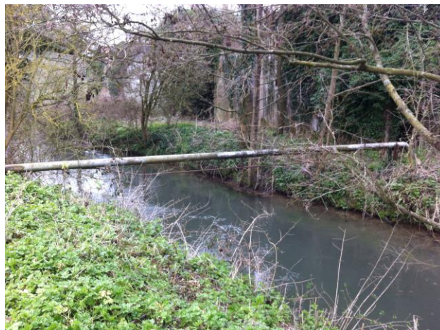
Bief avant travaux