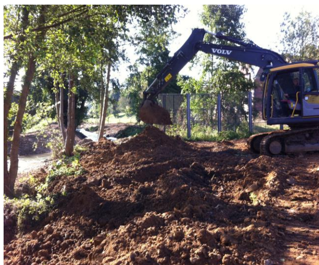
Comblement du bief