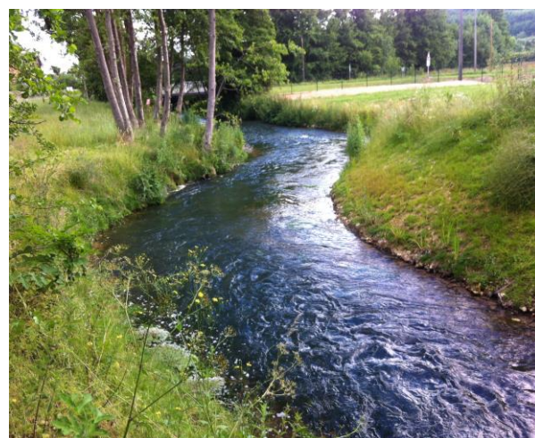
Site après aménagement