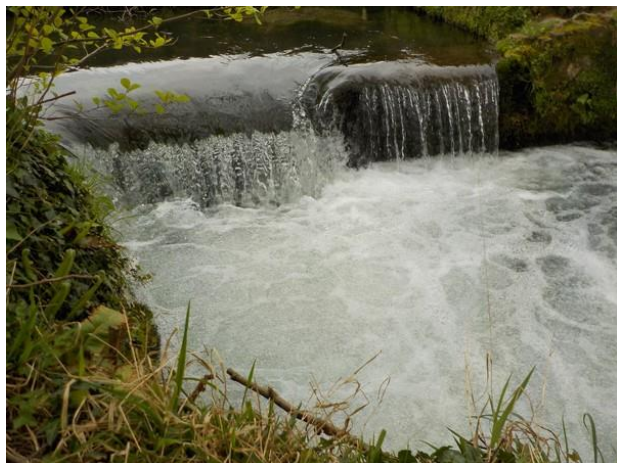
Seuil avant travaux