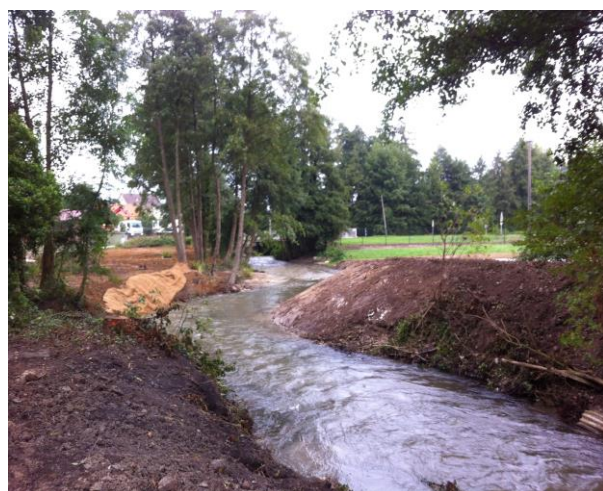
Tracé du nouveau bras