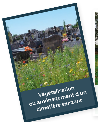
Végétalisation ou aménagement d'un cimetière existant

www.seinemaritime.fr/mon-cadre-de-vie/aides-aux-communes/portail-des-subventions.html