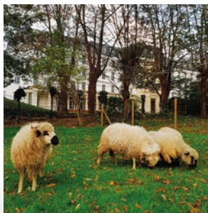
Eco-pâturage sur un espace public