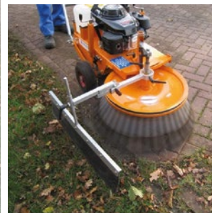
Achat de matériel alternatif