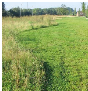
Réalisation d'un plan de gestion zéro phyto